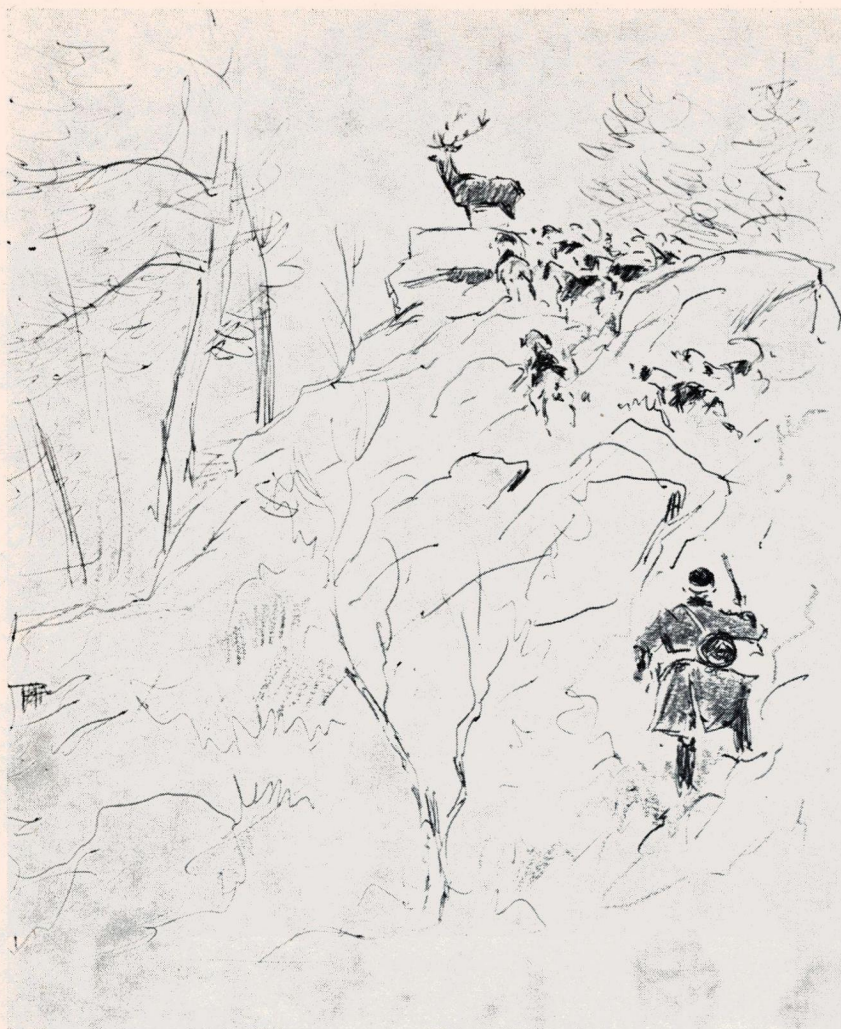
Jolibois dans les rochers d'Angennes.