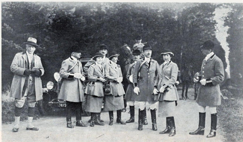
Au temps du Gaiement...