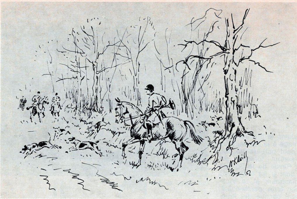
L'encre de Chine, l'aquarelle, deux expressions, un même art. Coll. Christiane Otto.