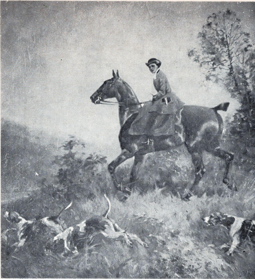
Ma mère, par mon père.